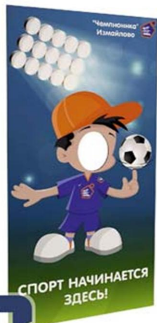
Тантамареска Эконом (помещение)

Тантамарески используются при проведении общественных мероприятий, торжеств, концертов, рекламных акций, на праздниках.